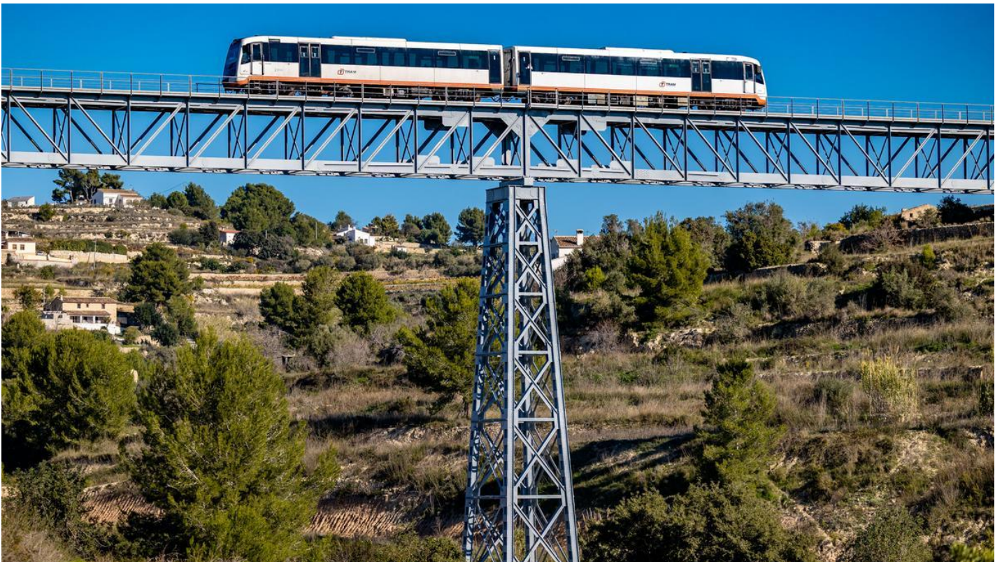
Viaducto del Quisi, una de las grandes obras de FGV en el TRAM en Benissa DAVID REVENGA

25·10·22 | 17:26 | Actualizado a las 17:34